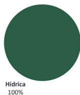
Mix da Oferta (4º Trimestre 2020)