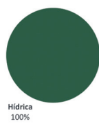
Mix da Oferta (3º Trimestre 2021)