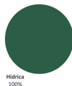
Mix da Oferta (4º Trimestre 2021)